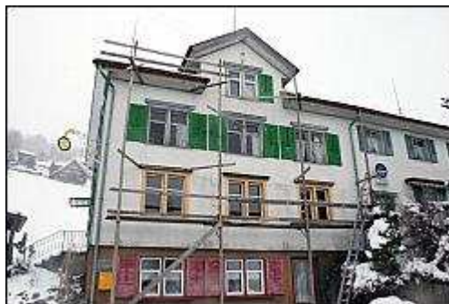
Brunner lässt die Sonne zum «Haus der Freiheit» umbauen.